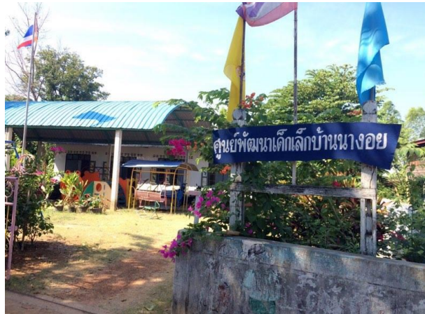
รูปที่ 10 ศูนย์เด็กเล็กบ้านนางอย

มูลนิธิฯ ได้ให้ความสนใจในการจัดตั้ง ในปี 2523 พระบาทสมเด็จพระเจ้าอยู่หัว สมเด็จพระนางเจ้าพระบรมราชินีนาถ พร้อมด้วยสมเด็จพระเทพรัตนราชสุดาและสมเด็จพระเจ้าลูกเธอเจ้าฟ้าจุฬาภรณวลัยลักษณ์ อัครราชกุมารี ได้เสด็จพระราชดำเนินที่บ้านนางอย-โปนปลาโหล ทรงทอดพระเนตรเห็นสภาพความยากจนของชาวบ้าน โดยเฉพาะเด็กที่กำลังเจริญเติบโตเป็นโรคขาดสารอาหารมีภาวะโภชนาการต่ำ โครงการพระราชดำริโดยศาสตราจารย์ ดร.อมร ภูมิรัตน์ ได้รับสนองพระราชโองการหาทางแก้ไขปัญหาดังกล่าว โดยการจัดตั้งศูนย์แห่งนี้ขึ้น ใช้ชื่อว่า “ศูนย์โภชนาการเด็กพระราชทาน” นับตั้งแต่นั้นมา