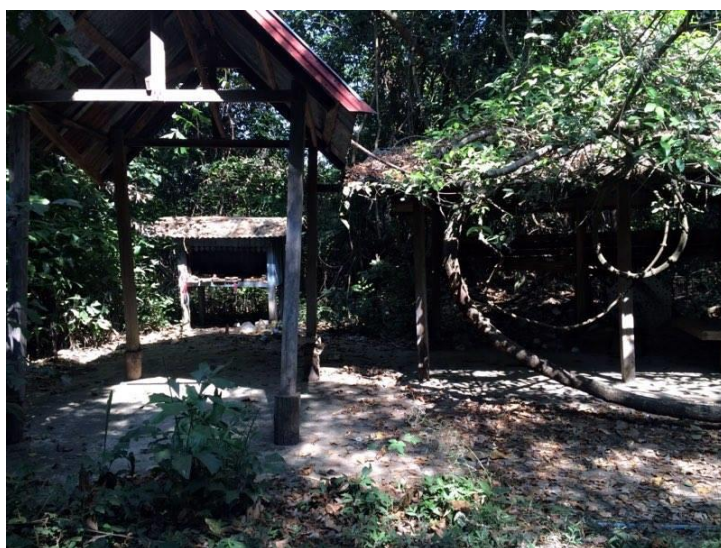
รูปที่ 6 คอนปู่ตาสาธารณะ

1. คอนปู่ตาสาธารณะ ตั้งอยู่ใกล้กลับหนองบัวเป็นสถานที่ประกอบพิธีกรรมในช่วงก่อนทำงาน คือ เดือน 6 ของทุกปี โดยชาวบ้านเชื่อว่า ปู่ตาเป็นผู้ปกปักรักษาหมู่บ้านและการเลี้ยงผีปู่ตา เพื่อบอกกล่าวให้ท่านได้รับรู้ การเลี้ยงนั้นเจ้าจ้ำจะจัดเตรียมเครื่องอาหาร คาวหวาน ผลไม้ต่างชนิดมาถวายและชาวบ้านก็จะเตรียมดอกไม้ ธูป เทียน เพื่อกราบไหว้ และขอพรจากปู่ตา ชาวบ้านเชื่อว่าปู่ตาเป็นสิ่งศักดิ์สิทธิ์ที่ดูแลพิทักษ์ รัญญาหารในไร่นาให้อุดมสมบูรณ์ และปกปักรักษาคนในหมู่บ้านให้อยู่เย็นเป็นสุข ชาวบ้านยังเชื่อเรื่องการบนบานสารกล่าว (บะ) ส่วนใหญ่ชาวบ้านจะบนเรื่องขอให้ทำมาหากินสะดวกสบาย สุขภาพร่างกายแข็งแรง การขอเลื่อนขั้นตำแหน่งหน้าที่การงานและขอให้ครอบครัวอยู่เย็นเป็นสุข ชาวบ้านเชื่อเรื่องปู่ตา จึงถือปฏิบัติสืบต่อกันมาของคอนปู่ตาสาธารณะ