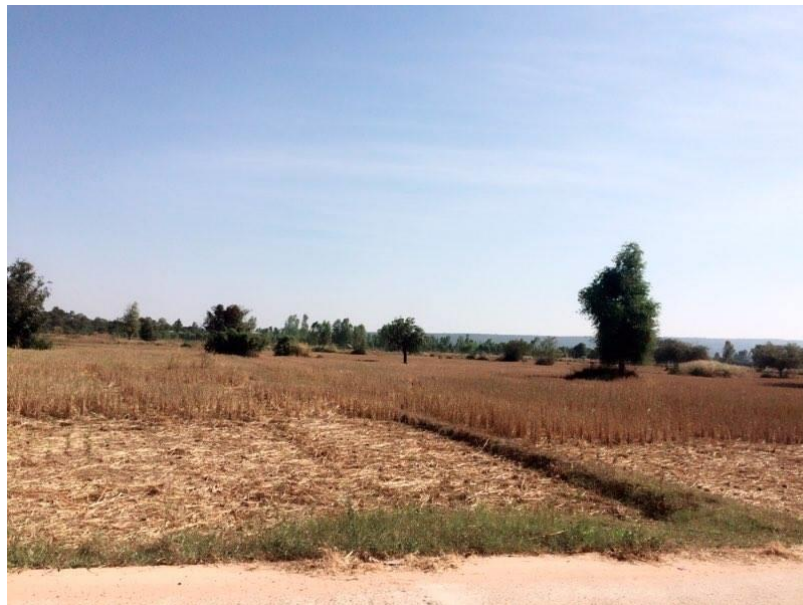
รูปที่ 1 ลักษณะของดิน

ดินมีลักษณะเป็นดินร่วนปนดินทรายเป็นส่วนมาก และดินเปรี้ยวหรือดินกรดอยู่บริเวณหนองบัว ซึ่งหนองบัวเป็นหนองสาธารณะของหมู่บ้าน เป็นแหล่งน้ำสาธารณะอุปโภคของบ้านนางอยบริเวณรอบๆ หนองบัวถึงแม้จะเป็นดินกรด แต่ก็สามารถทำการเกษตรได้มีการทำนาปลูกข้าวและข้าวที่ปลูกเป็นข้าว กข6 พืชที่ปลูกในบ้านนางอยส่วนมากคือ มะเขือเทศ ข้าวโพดฝักอ่อน พริกมะเขือเปราะ และมีพื้นที่ทั้งหมด 3,438 ไร่