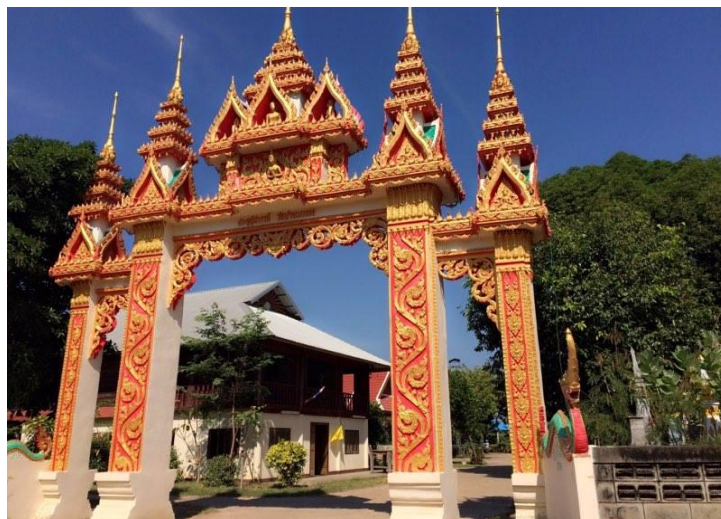
รูปที่ 7 วัดบ้านนางอย ตำบลนางอย อำเภอเต่างอย จังหวัดสกลนคร