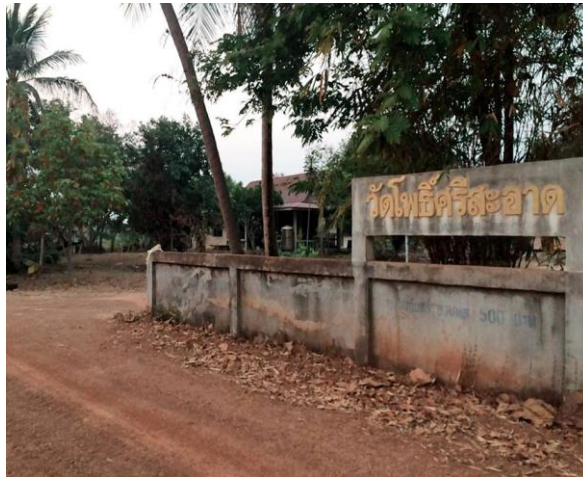
รูปที่ 8 วัดโพธิ์ศรีสะอาด