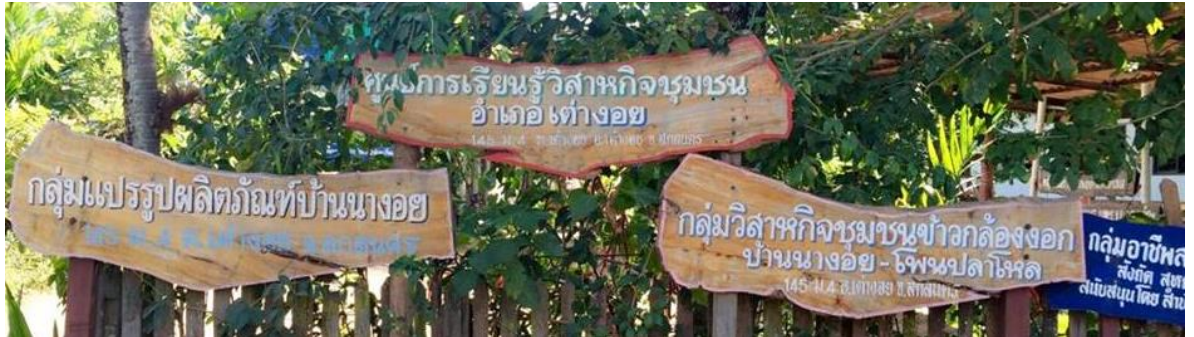
รูปที่ 5 กลุ่มวิสาหกิจชุมชนข้าวกล้องงอกบ้านนางอย-โพนปลาไหล รายชื่อคณะกรรมการกลุ่มวิสาหกิจชุมชนข้าวกล้องงอกบ้านนางอย-โพนปลาไหล