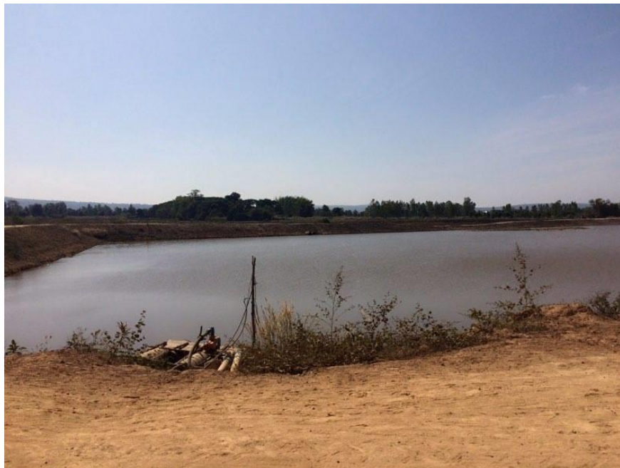
รูปที่ 2 แหล่งน้ำที่สำคัญหนองบัว บ้านนางอย

2. อ่างเก็บน้ำห้วยคือ เป็นอ่างน้ำที่ปล่อยน้ำมาให้ชาวบ้านทำการเกษตร ปลูกข้าว มะเขือเทศ เลี้ยงสัตว์ และอื่นๆ อ่างเก็บน้ำห้วยคือสามารถไปตกปลา และใสมองได้ในครึ่งหลังของอ่างเก็บน้ำ ส่วนครึ่งหน้าของอ่างเก็บหนองคือจะไม่ให้พันธุ์ปลาเพราะจะเพาะพันธุ์ปลาเอาไว้ ส่วนครึ่งหลังก็ไม่สามารถหว่านแหได้เพราะมีตอขึ้นเยอะและในการปล่อยน้ำก็จะปล่อยให้ชาวบ้านในชาวฤดูทำการเกษตรและหลังจากวันที่ 10 เดือนเมษายนก็จะปิดน้ำการปล่อยน้ำจะปล่อยเป็นเวลาเพราะถ้าไม่ปล่อยเป็นเวลานานในอ่างเก็บน้ำ ก็อาจจะมิปริมาณน้ำไม่เพียงพอ