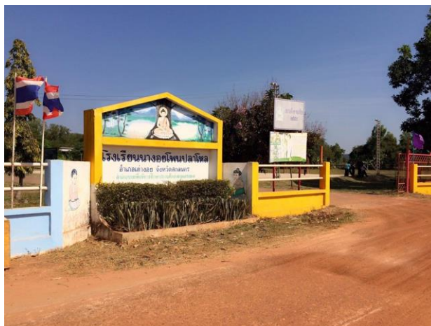
รูปที่ 9 โรงเรียนนางอยโพนปลาโหล

โรงเรียนนางอยโพนปลาโหล ตั้งอยู่หมู่ที่ 4 ตำบลนางอย อำเภอเต่างอย จังหวัดสกลนคร สำนักเขตพื้นที่การศึกษาสกลนคร เขต 1 รหัสไปรษณีย์ 47260 โรงเรียนนางอย-โพนปลาโหลเดิมนักเรียนเดินทางไปโรงเรียนที่โรงเรียนชุมชนเต่างอย ตั้งอยู่หมู่ที่ 3 ตำบลนางอย อำเภอเต่างอย จังหวัดสกลนคร ห่างไกลจากหมู่บ้านประมาณ 1 กิโลเมตร เวล่านักเรียนไปต้องเดินผ่านทุ่งนา ลำห้วย ทำให้การไปมาลำบาก จึงเป็นสาเหตุหนึ่งที่ทำให้นักเรียนขาดเรียนเป็นประจำความรู้ความสามารถของนักเรียนจึงอ่อนมาก