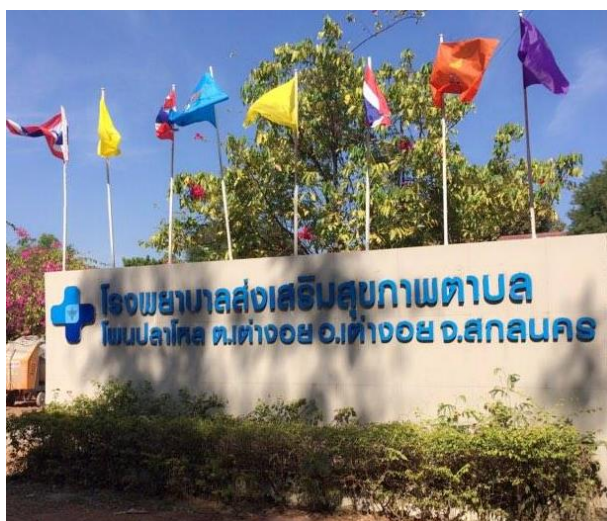
รูปที่ 11 โรงพยาบาลส่งเสริมสุขภาพตำบลบ้านโปนปลาโหล